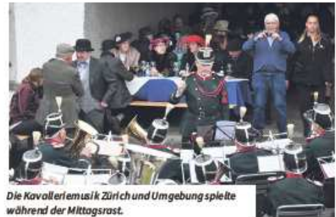
Die Kavalleriemusik Zürich und Umgebung spielte während der Mittagsrast.

Viele Freunde historischer Kutschen beobachteten die Gespanne am Strassenrand oder auf den Rastplätzen. Auch bei der dritten Durchführung konnten sie wieder Neuentdeckungen machen und neue Leute kennenlernen. Zahlreiche jüngere Fahrer belebten das sonst eher verstaubte Image der Traditionsfahrer. Sie sorgten einzeln auch mit ihren teilweise extravaganten Kleidern für Aufsehen. Auffallend waren auch die vielen Gespanne, auf denen Frauen die Leinen in die Hand nahmen.