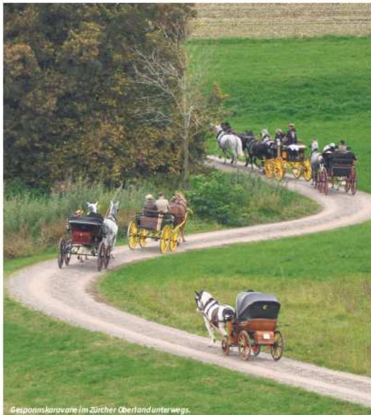
Gespannkarawane im Zürcher Oberland unterwegs.